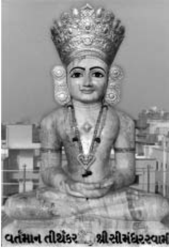
વર્તમાન તીર્થંકર શ્રી સીમંધર સ્વામી

બીજું કંઈનું કંઈ મળત. પણ આ મંદિરોનો ઉપાય ઘણો જ સારો છે. મૂર્તિ એ તો હિન્દુસ્તાનનું આ મોટામાં મોટું 'સાયન્સ' છે. એ સારામાં સારી પરોક્ષ ભક્તિ છે, પણ જો સમજે તો. મંદિર હોય તો ભગવાનને 'પધારો' એમ કહેવાય ! નહીં તો ભગવાન ક્યાં પધારે ? હવામાં ઊડે એ કામ ના આવે. એક જગ્યાએ સ્થિર થયેલું હોય ત્યાં 'પધારો' કહેવાય.